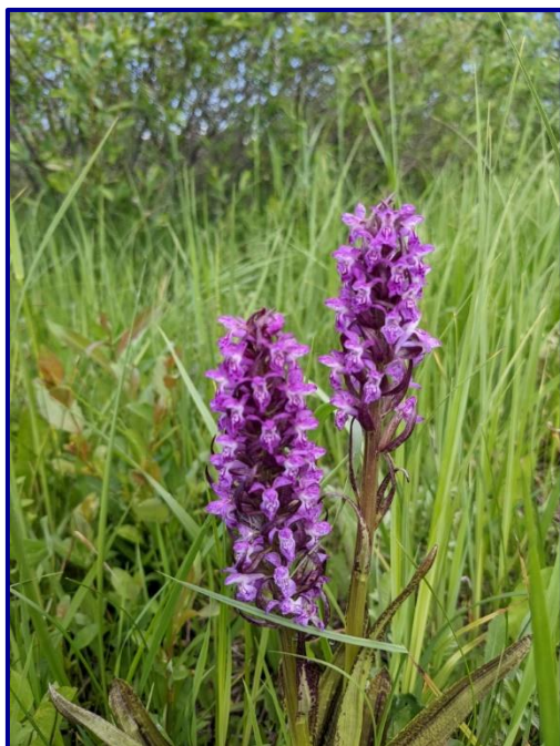
Рисунок 3. Редкий вид Dactylorhiza baltica на влажном лугу в окрестностях с. Курманайбаш в Миякинском районе РБ (15.06.2022; фенофаза – массовое цветение;)