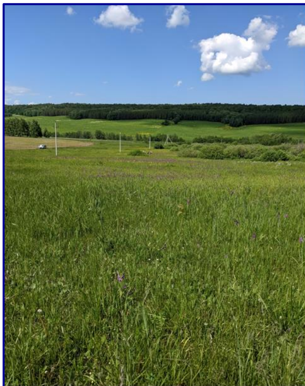
Figure 2. The habitat of Gladiolus tenuis on a wet meadow in the vicinity of the village Kurmanaibash in the Miyakinsky District of the Republic of Bashkortostan (June 15, 2022)

Здесь обнаружено новое местообитание редкого вида пальчатокоренника балтийского Dactylorhiza baltica (Klinge) Orlova (п. длиннолистный D. longifolia (L. Neum.) Aver.) (сем. Орхидные – Orchidaceae Juss.), включенного в «Красную книгу Республики Башкортостан» [Мартыненко 2021] (Рис. 3).