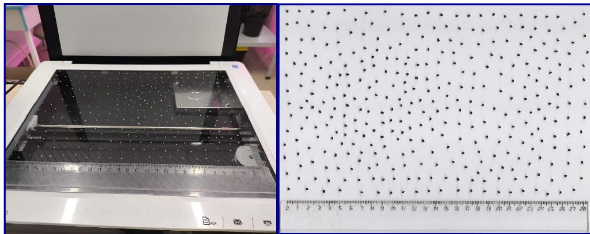
Рис. 1. Сканирование семян A. fistulosum : сканер (слева), изображение (справа), 2025 год Fig. 1. Scanning of A. fistulosum seeds: scanner (left), image (right), 2025

Суть метода: измерение морфометрических и оптических параметров семян осуществляли путем анализа их цифровых изображений с помощью программного обеспечения «ВидеоТест-Морфология». Программное обеспечение позволяет выделить объекты интереса (от фона) по цвету и яркости, либо порогу яркости, измерить в реальных геометрических величинах выделенные объекты (изображения семян), а также получить таблицу измерений по каждому объекту. Алгоритм работы программы представлен на рисунке 2.