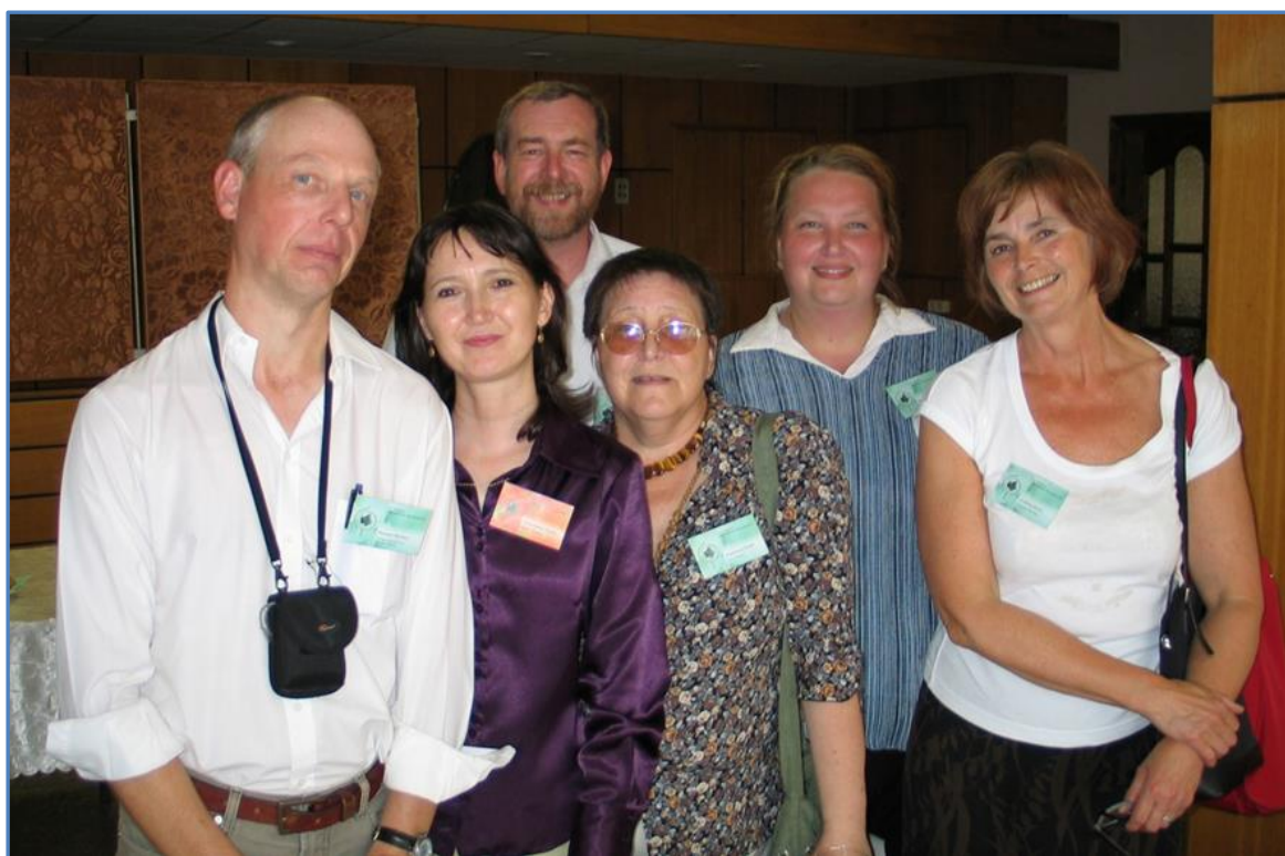
С проф. Ричардом Бекеттом (крайний слева), проф. Ф.В. Минибаевой (вторая слева) и проф. М.Ф. Шишовой (вторая справа) на II международном симпозиуме "Сигнальные системы клеток растений» (Казань, 2006 г.).