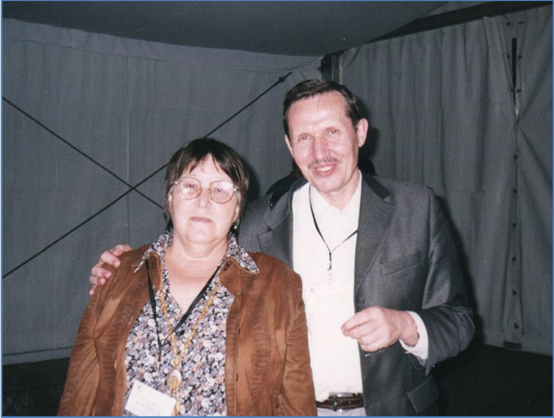
С член-корр. РАН Вл.В. Кузнецовым (ИФР РАН, Москва)