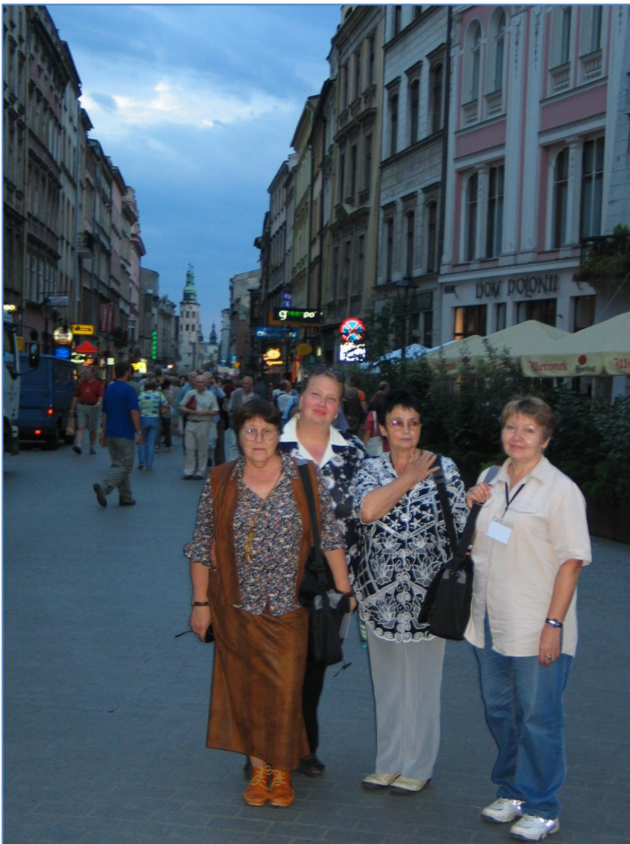
Прогулка с коллегами по улицам Кракова (2004 г.)