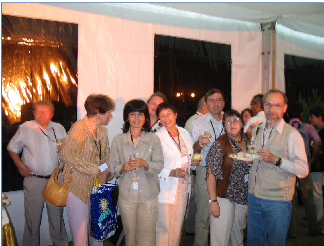
С коллегами на XIV Конгрессе Европейского общества физиологов растений в Кракове (2004 г.)