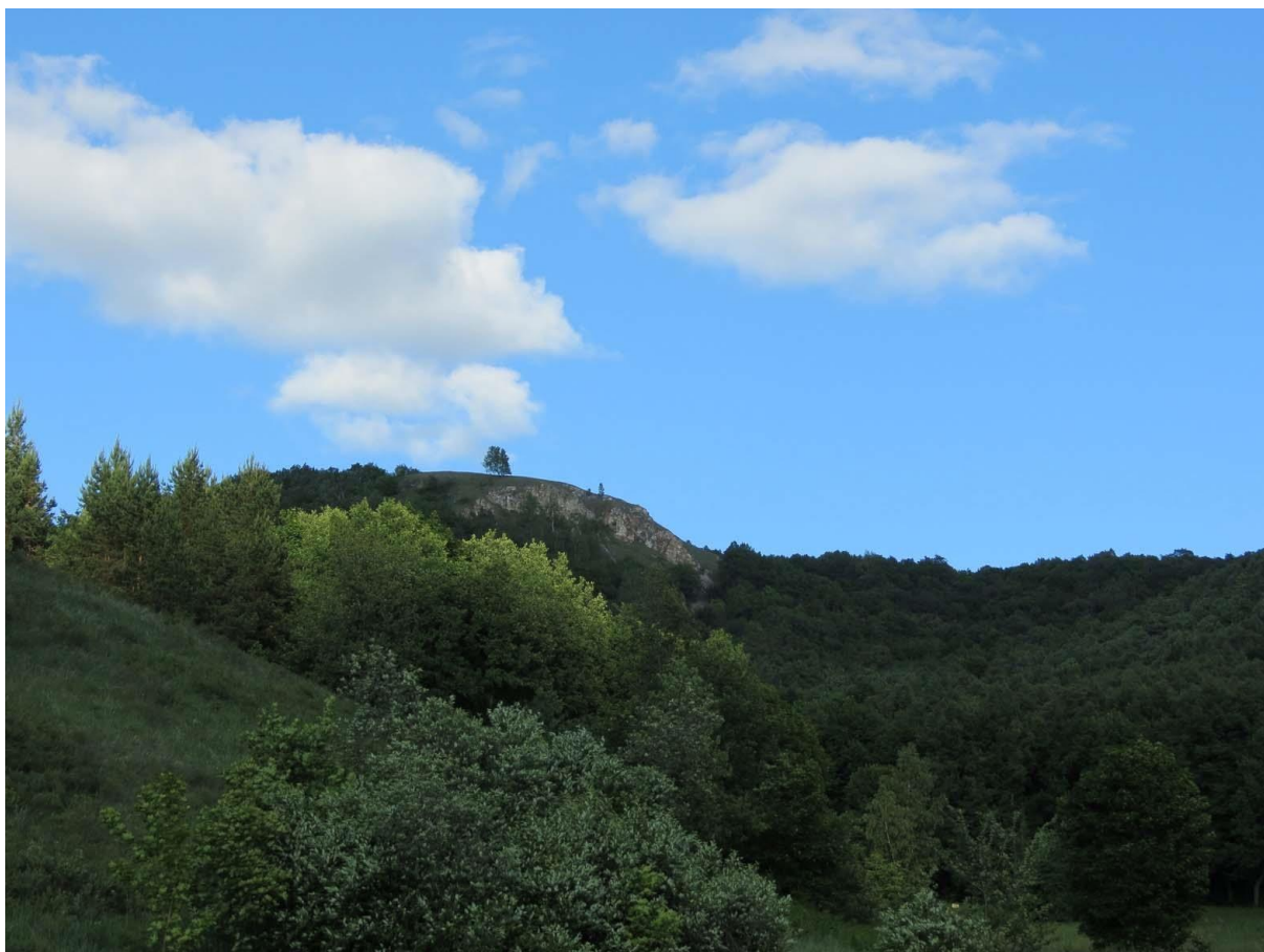
Рис. 1. Гора Бикмаш – перспективный памятник природы

Одним из таких природных объектов, где требуется первоочередная охрана редких видов растений и эндемичных растительных сообществ является гора Бикмаш, расположенная в Ишимбайском административном районе Республики Башкортостан в 2,6 км к югу от села Сайраново (рис. 1).