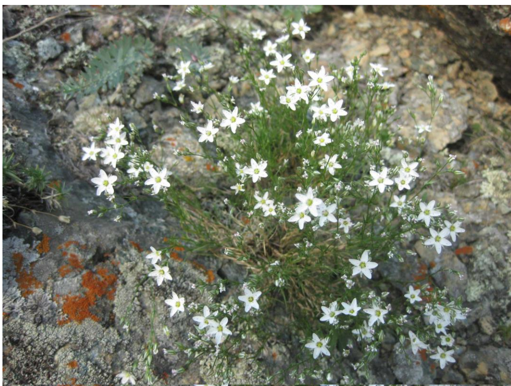
Рис. 8. Минуарция Крашенинникова ( Minuartia krascheninnikovii ) на горе Бикмаш