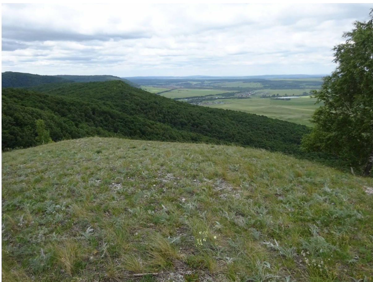
Рис. 2. Эндемичные сообщества каменистых степей на вершине горы Бикмаш