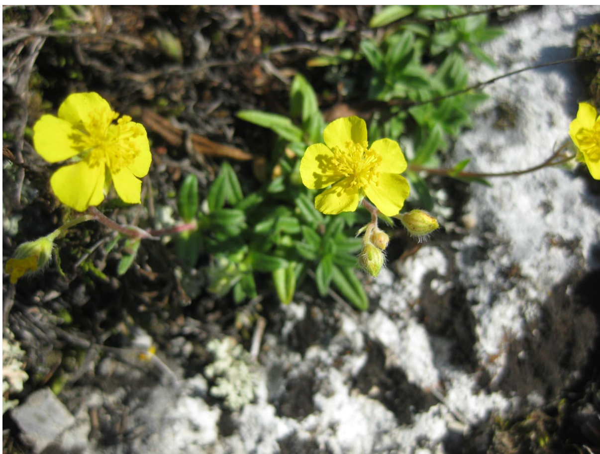
Рис. 9. Солнцезвезд башкирский ( Helianthemum baschkirorum ) на горе Бикмаш

В РБ солнцезвезд башкирский (рис. 9) малоизученный вид. Из 15 известных местонахождений численность вида высокая только в трех пунктах – на горах Бикмаш и Йеласын-таш (обе горы находятся на территории Геопарка «Торатау») и в урочище «Большой Камень» на Абдуллинской горе у села Метели (Дуванский район). В других пунктах численность популяций низкая [Красная книга..., 2011].