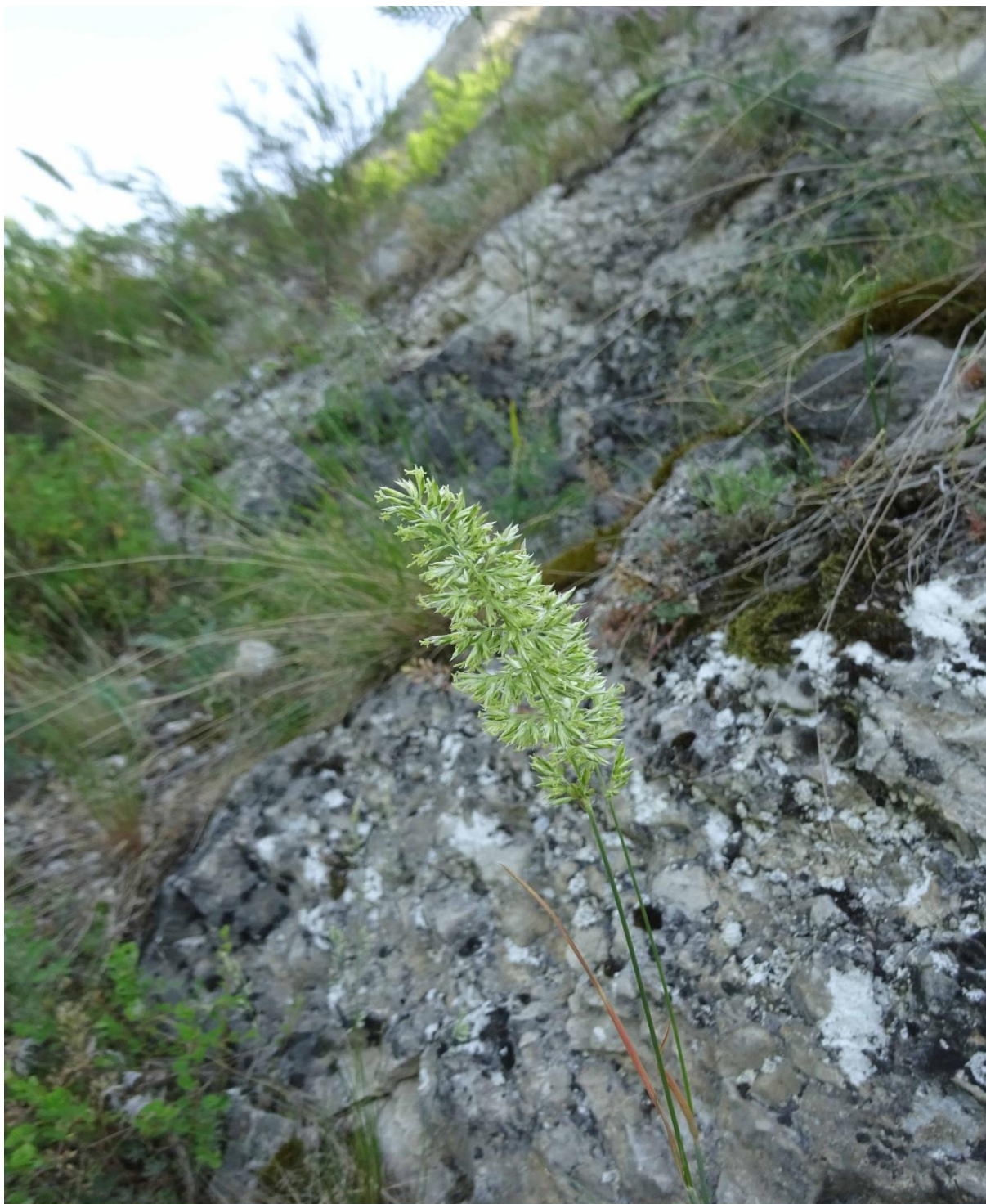
Рис. 10. Тонконог жестколистный ( Koeleria sclerophylla ) на горе Бикмаш

Koeleria sclerophylla – эндемик Среднего Поволжья, Заволжья и Южного Урала (рис. 10). Редкий вид Урала и Приуралья [Горчаковский, Шурова, 1982; Кучеров и др., 1987]. Вид включен в Красную книгу РБ [2011] со статусом 3 – редкий вид. Также включен в Красную книгу РФ [2008], на ближайших территориях входит в Красные книги Республики Татарстан [2016], Оренбургской [2019] и Челябинской [2017] областей. Включен в Красный список Международного союза охраны природы (МСОП) [Walter, Gillet, 1997].