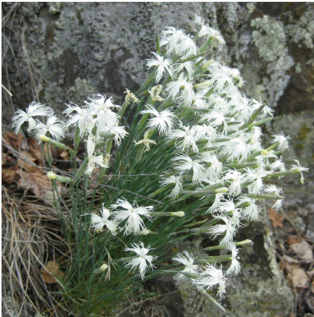
Рис. 7. Гвоздика иглолистная ( Dianthus acicularis ) на горе Бикмаш