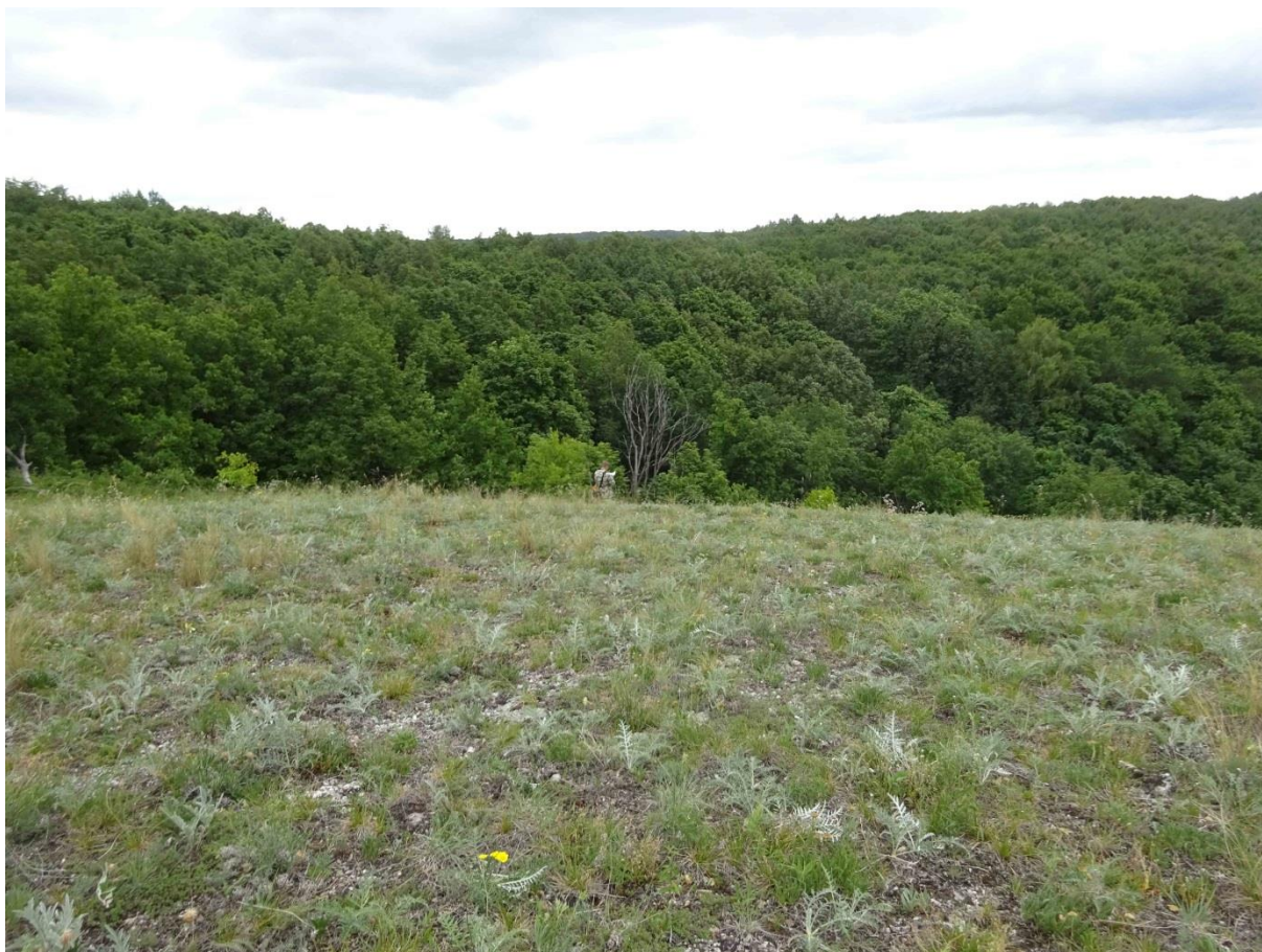
Рис. 5. Сообщества каменистых степей с произрастанием редких видов – место проведения учетов

Клок. et Shost.), солнцезвезд башкирский ( Helianthemum baschkirorum ). Проективное покрытие травостоя (в том числе и дерновинных видов) низкое – около 40 %, что, видимо, способствует семенному самовозобновлению редких видов, которые обычно характеризуются низкими конкурентными возможностями. Проективное покрытие щебня составляет около 20 %, мхов – 10 %, кустистых лишайников – 20 % и суши (отмершая трава) – 10 %. Очень интересно, что физиономически и по видовому составу эти сообщества напоминают каменистые степи на карбонатных и основных породах Учалинского мелкосопочника (восточный склон Южного Урала).