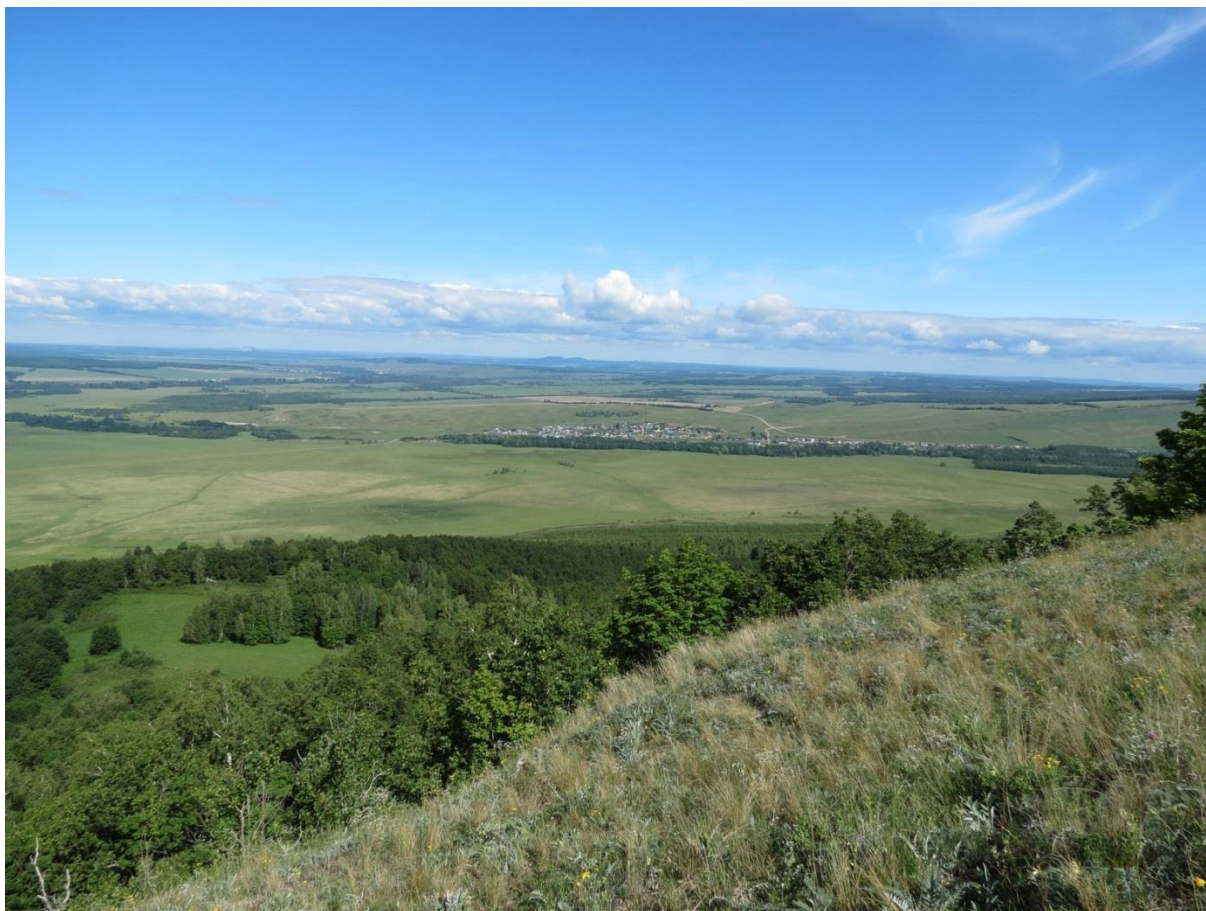
Рис. 4. Вид с горы Бикмаш на равнинные просторы Предуралья

Предполагается организовать на горе регулируемый туристический поток, поскольку сама гора является хорошей смотровой площадкой с передовых хребтов Южного Урала на равнинное Предуралье (рис. 4).