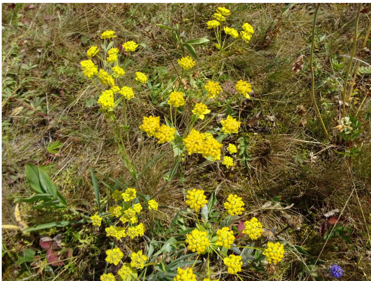
Рис. 6. Володушка многожилчатая ( Bupleurum multinerve ) на горе Бикмаш

Популяция володушки многожилчатой малочисленная (рис. 6). На трансекте учтено 16 растений (из них 5 прегенеративных и 11 генеративных). На 1 м 2 произрастает по 1-2 особи. Растения удалены друг от друга на 1-8 м. Самовозобновление слабое, не ежегодное. Состояние популяции критическое.