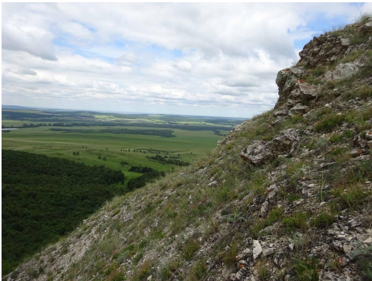
Рис. 3. Наскальная растительность на горе Бикмаш

володушка многожилковая – Vupleurum multinerve DC. и др.). В каменистых степях встречается 4 вида, включенных в Красную книгу РБ [2011]: солнцезвезд башкирский ( Helianthemum baschkirorum (Juz. ex Kupatadze) Tzvel.), тонконог жестколистный ( Koeleria sclerophylla P. Smirn.), минуартия Крашенинникова ( Minuartia krascheninnikovii Schischk.) и ковыль перистый ( Stipa pennata L.). Три последних вида также включены в Красную книгу Российской Федерации (РФ) [2008]. Кроме того, 4 вида были включены в предыдущее издание Красной книги РБ [2001] и в настоящее время их популяции нуждаются в строгом контроле [Приложение II; Красная книга..., 2011].